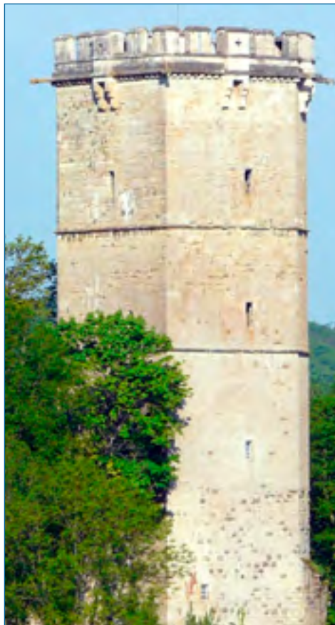
Tour de l'Aubespin