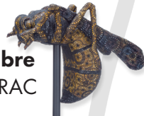
© Joana Vasconcelos, Guigogne 2013, FRAC Bourgogne, Adagp 2018

■ Samedi 17h : DÉAMBULATION MUSICALE DES CORPS CREUX /durée 1h30 Reportée au dimanche 16 septembre à 16h en cas de mauvais temps. « Le souffle de l'attraction », déambulation musicale au cœur du Parc Buffon. Un projet de la Musique des Corps creux de Montbard. Départ depuis la cour du Musée Buffon. La Musique des Corps creux propose un projet inédit mêlant musique, danse, graphisme et sport avec le CRC de Montbard, le chœur Offenbach, le compositeur Adrien Desse et le trialiste Alexis Brunetaud. Cette création autour du spectacle vivant mobilise près de 55 participants qui conduiront le visiteur à travers les différents univers musicaux et sonores du Parc Buffon. Le concert se terminera dans la cours de l'hôtel Buffon par un apéritif/ concert. Avec le soutien de la Ville de Montbard et la Communauté de Communes du Montbardois.